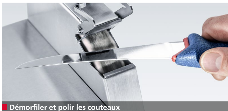
■ Démorfiler et polir les couteaux

L'affûtage des couteaux n'a jamais été aussi simple qu'avec la Z 200. Grâce au dispositif de guidage magnétique précis, la lame est maintenue à un angle optimal, durant l'affûtage comme pendant le polissage, pour un résultat parfait obtenu en toute sécurité et facilité.