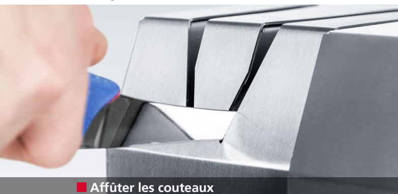
■ Affûter les couteaux